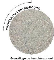
Grenillage de l'enrobé existant